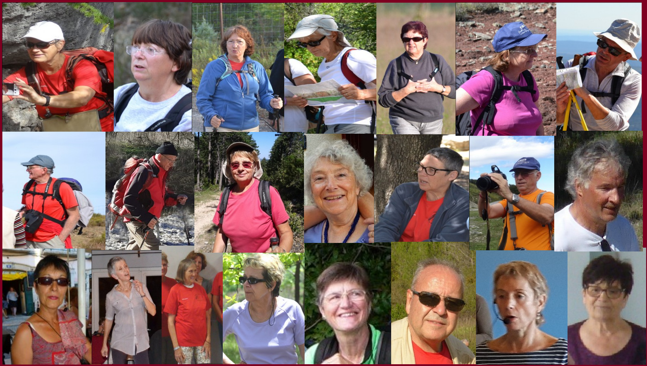
Tou(te)s les Animateur(trice)s Bénévoles ESL